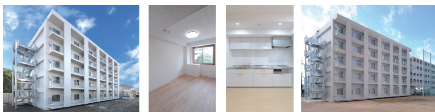
หอพักนานาชาติ ที่วิทยาเขตชิซุโอกะและฮามามัตสึ (สร้างเสร็จเมื่อ เดือนมีนาคม พ.ศ. 2559) แต่ละยูนิตประกอบด้วยห้องพักเดี่ยวพร้อมเฟอร์นิเจอร์ครบครัน 5 ห้องและพื้นที่ส่วนกลางซึ่งใช้ร่วมกัน

มหาวิทยาลัยมีที่พักอาศัยสำหรับนักศึกษาต่างชาติทุกคน ค่าเช่ารายเดือนอยู่ที่ประมาณ 20,000 เยน มีอินเทอร์เน็ตความเร็วสูงในห้องพักทุกห้อง